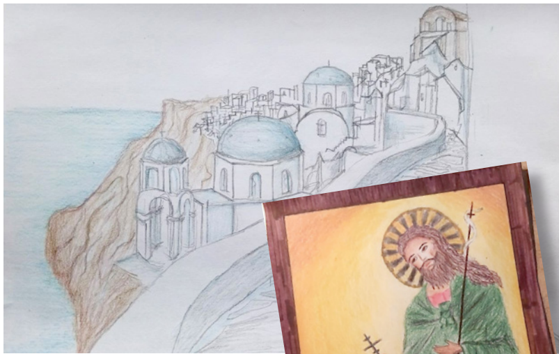
Свети Јован крститељ Аутор- Ана Ердевички