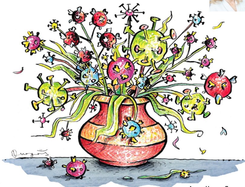
Аутор: Никола Драгаш