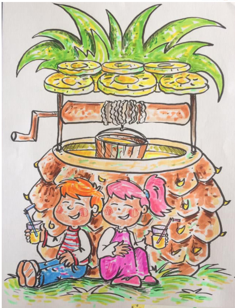
Даница Ј. Школа српског језика и културе из Сан Дијега