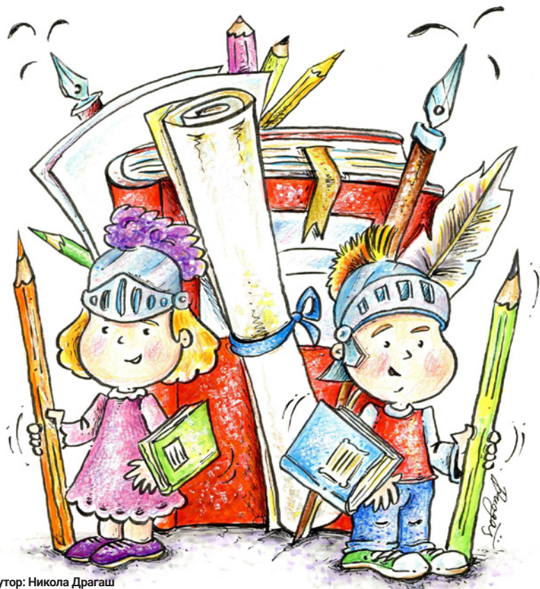
Аутор: Никола Драгаш