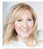
Пише: Гордана ЛАКОВИЋ

Светлост је обасјала душу, поневши је неком далеком оркану неке моје још неисказане будућности