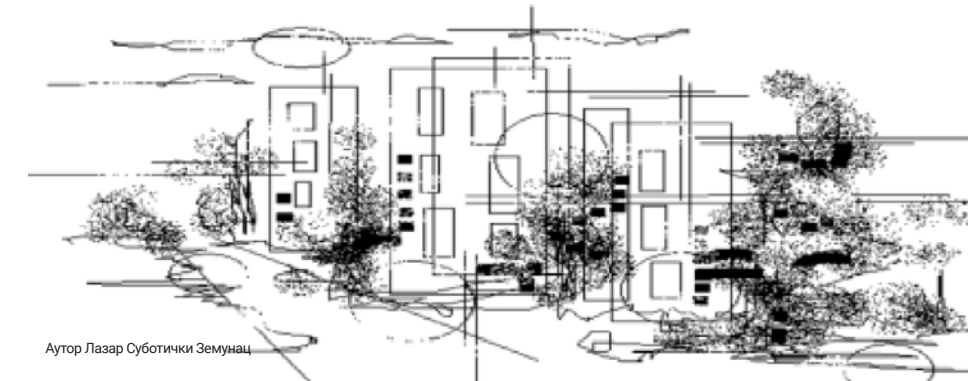
Аутор Лазар Суботички Земунац