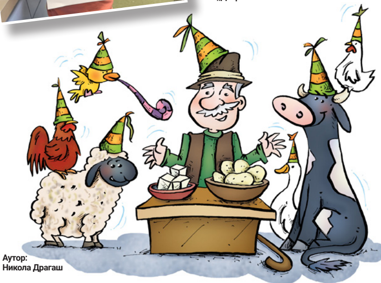
Аутор: Никола Драгаш