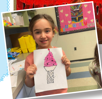
Емили Мушић (7) Српска школа „Никола Тесла„Детроит