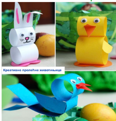
Креативне пролећне животињнице

лепак , боја , старе ролне туалет папира, колаж папир.