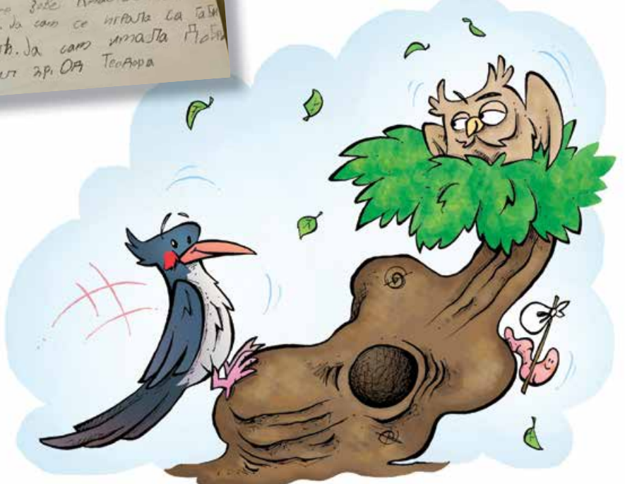
Аутор: Никола Драгаш