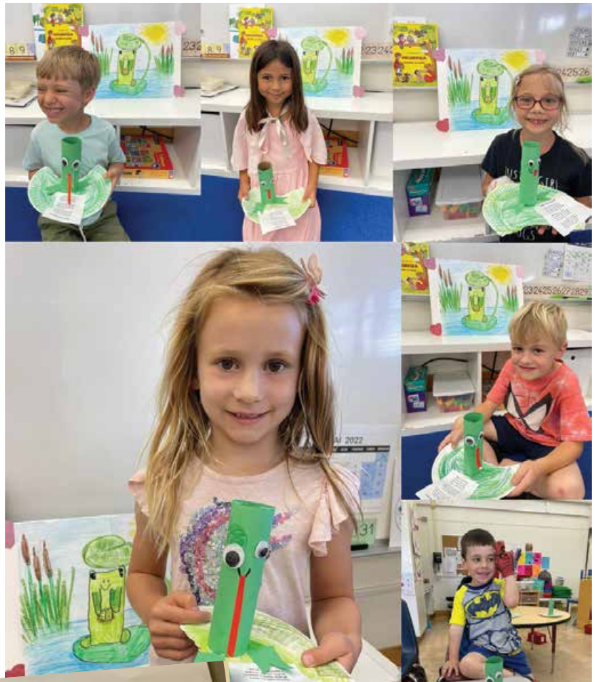
Деца у Српском културном центру у Сан Дијегу, инспирисана чика Јовином песмом ЖАБА ШИТА НОВИНЕ