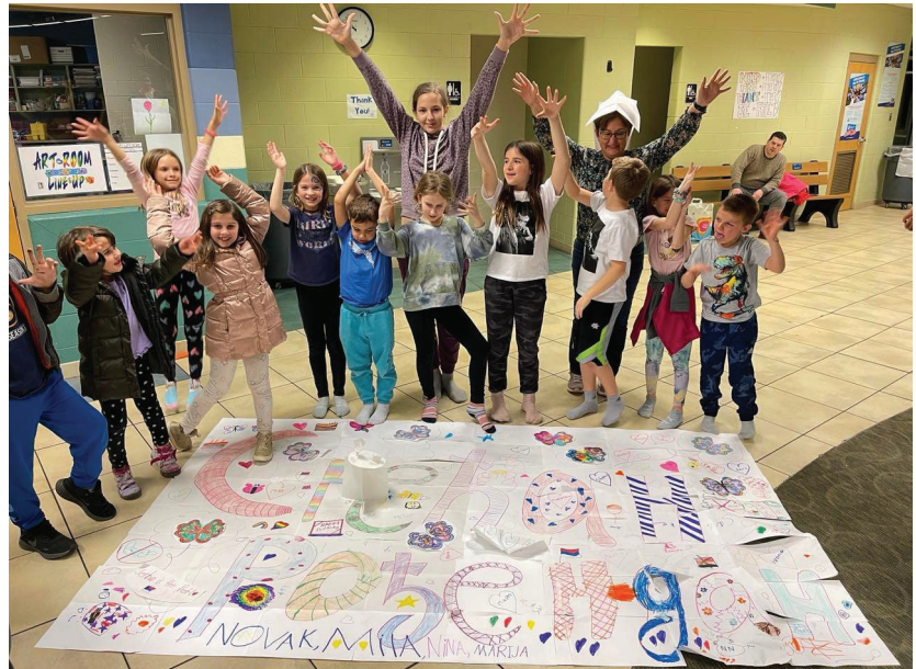
Ђаци Српске школе НИКОЛА ТЕСЛА из Детроита