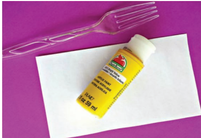
Маслачак: потребна је пластична виљушка и жута темпера