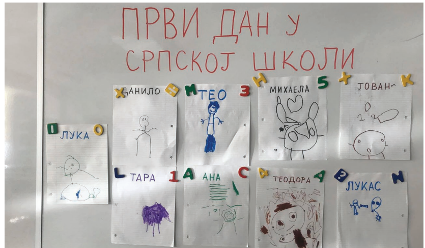
Српска школа СВЕТИ САВА, Кичинер - Ватерло