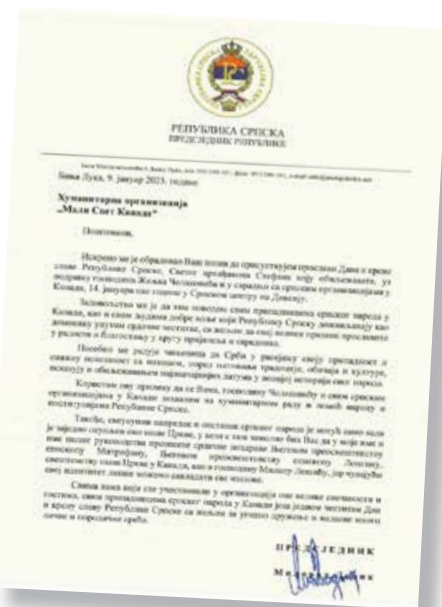
Писмо Милорада Додика упућено домаћинима славе „Малом свету канада“

У прецуној сали Српског центра у Мисисаги одржан је и свечани