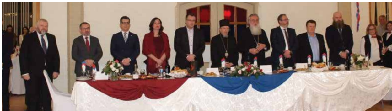
Угледни гости на прослави Дана Републике Српске у Мисисаги

У МИСИСАГИ ЈЕ 14. ЈАНУАРА СВЕЧАНО ПРОСЛАВЉЕН ДАН РЕПУБЛИКЕ СРПСКЕ