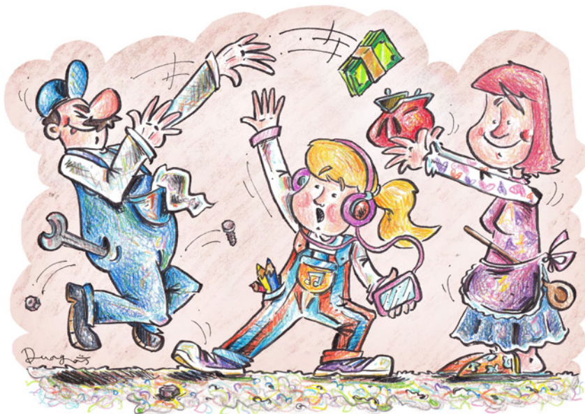
Право у кош Аутор: Никола Драгаш

Неколико каменчића Парче дрвета или пањ.