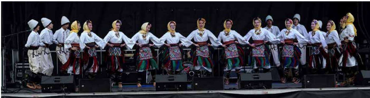
Фолклорашки су одушевили својом игром

се у будућности придружити много више људи и да ће Канада, не само на локалном и покрајинском нивоу, увидети значај ове манифестације. Никола Тесла је свој сан о Нијагари остварио, а ми се надамо да ћемо баш овде, у Нијагара Фолсу, наставити да одржавамо фестивал њему у част који ће бити препознатљив у целом свету.