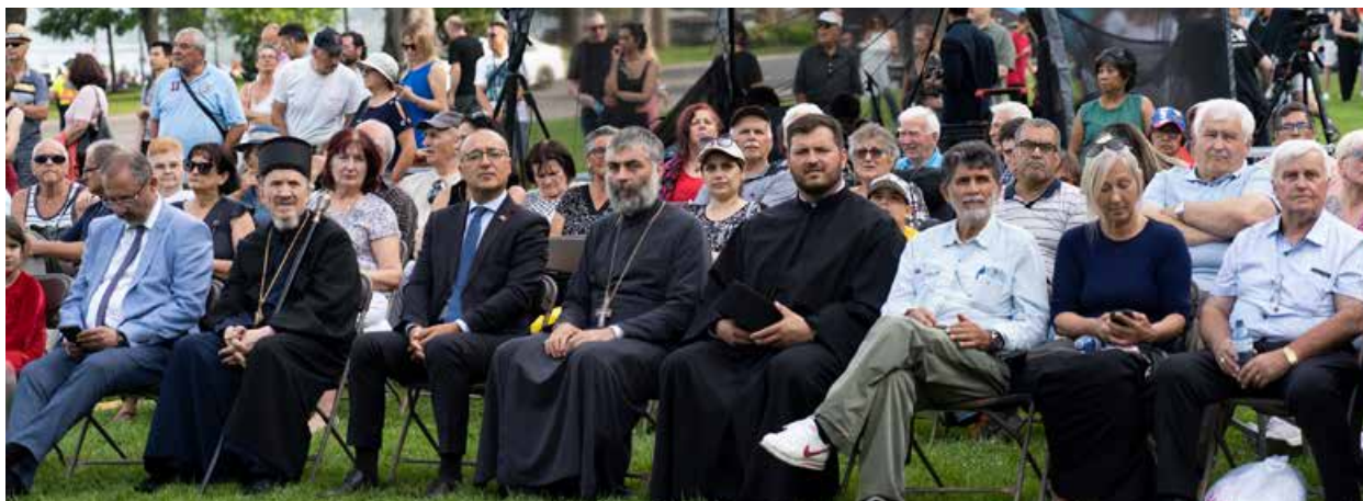
Угледни гости на првом Међународном дану Николе Тесле поред Нијагариних водопада