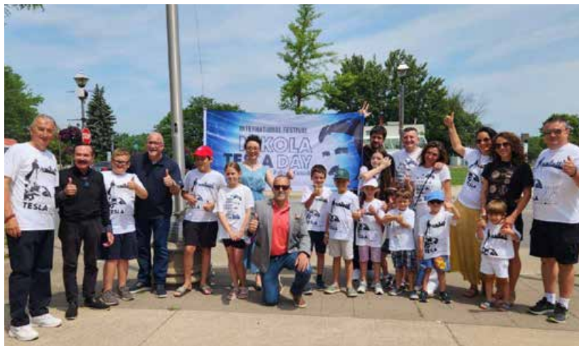
Дизање заставе првог Међународног фестивала у част Николе Тесле